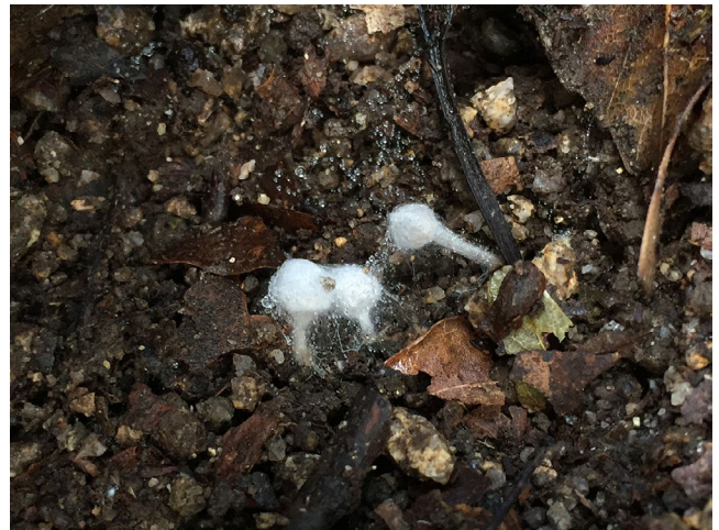
図 4. 発達した柄を持つセコチウム型子実体.

11月15日、前回の発生地よりやや下の場所を探していたところ、図1,2のきのこと同様に白い菌糸で覆われた、変わった姿のセコチウム型菌を見つけることができました(図4)。