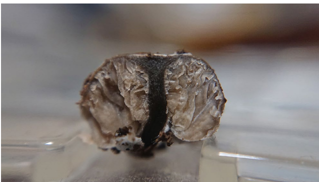
図 3. 上述の不明菌の断面. セコチウム型であることが確認できる.

その後は2週間に一回のペースで現地を訪れては観察を繰り返していました。2019年の発生時にも、標本を解剖して観察していましたが、今回ようやくきれいな個体が見つかりその正体が少し判明してきました。白い塊の断面はまるできのこが凝縮し