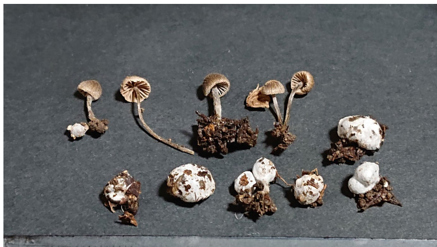
図 5. セコチウム型菌と、その近くで見つかったイッポンシメジの仲間.

このセコチウム型菌とイッポンシメジの仲間の関係性は今のところ分かりませんが、これまで、この不明なきのこは福岡県の他に神奈川県、山梨県、岐阜県、長野県などで発生が確認されているとのことです(折原・山本、私信)。今回見つかった