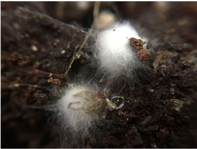
図 2. 地下生菌に似た不明菌の子実体原基.

発生地には1ヵ月に一度訪れてみました。変化が出始めたのは2020年10月30日で、菌糸の塊が発生し始めていました(図2)。